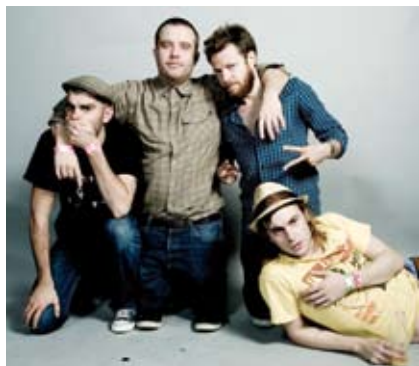
BIRDY NAM NAM